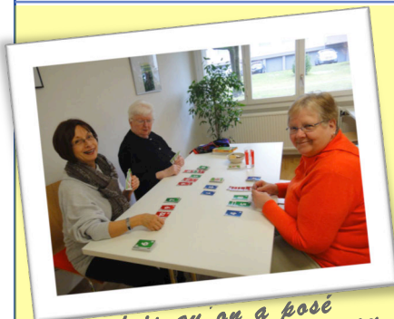
Une fois qu'on a posé pour la photo, on joue au Skipbo ici par ex.!