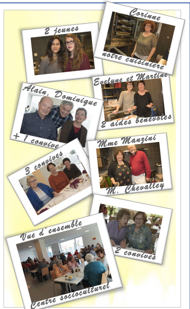
Certaines de ces photos ont été publiées dans le Clic-Clac de 24H du 20 janvier 2015. Et oui, rien que ça!

Ne tardez pas à vous inscrire pour les prochains. Le nombre de places est limité! Avec les bénévoles, nous sommes plus de 40 participants!