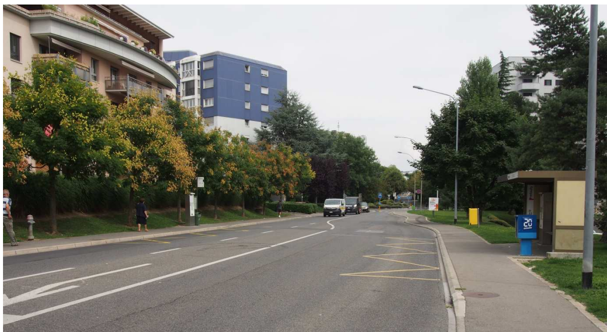
Arrêt de bus de Préfaully

« C'est génial car on a tout à disposition, le bus, le métro, et on est tout proches de la gare de Renens. »