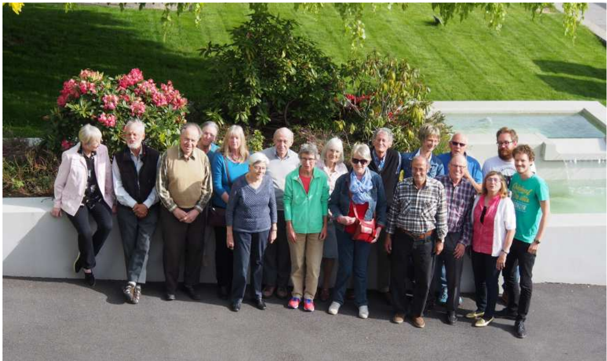
Membres du groupe habitants

Les rencontres de ce groupe ont eu lieu essentiellement à la buvette du Collège de la Concorde mais aussi à trois reprises dans la salle Jéricho du Centre paroissial de Chavannes-Epenex.