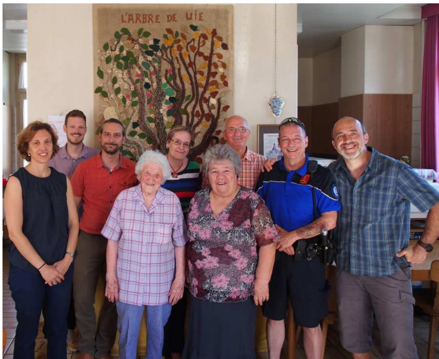
Membres du groupe ressources

A noter que les liens aux sites internet des partenaires sont indiqués sur la page internet du projet, sur le site www.quartiers-solidaires.ch