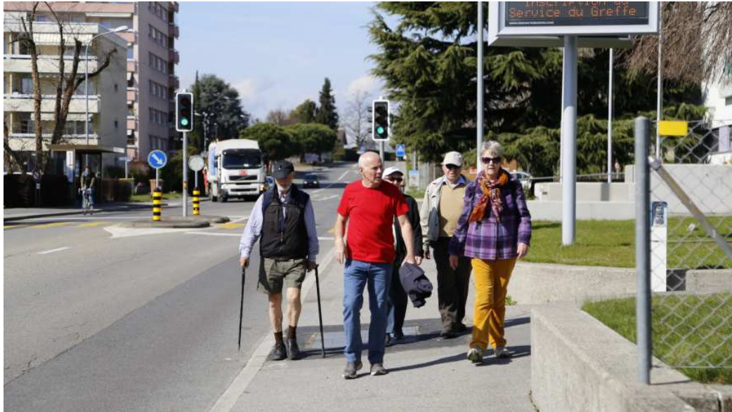
Marche du 20 mars 2017

tous, cette activité a rencontré du succès et permis de tisser plus de liens entre les participants. A noter que des personnes ne venant pas au groupe habitants y ont pris part.