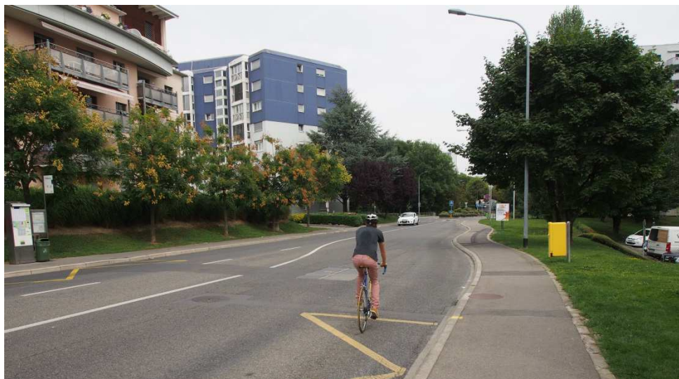
Un cycliste à Chavannes

l'égard des contrevenants, qu'il s'agisse des cyclistes ou des automobilistes, eux aussi pas toujours respectueux des limitations de vitesse en vigueur à l'intérieur de la localité.