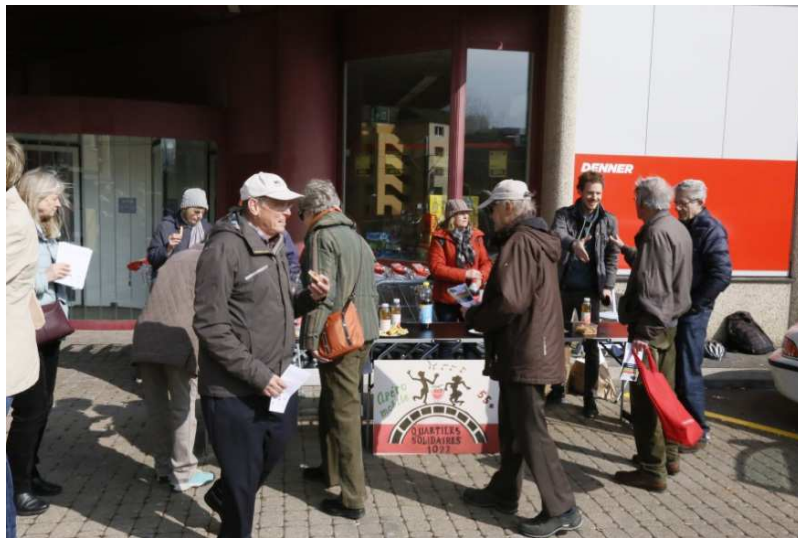
Apéro mobile du 25 mars

passants. Enfin, une affiche (voir photo ci-dessous), a été réalisée par une habitante afin de rendre ces stands plus visibles.