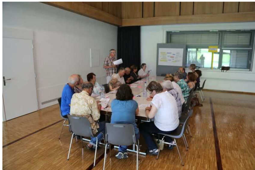
Atelier lors du forum

Au sujet de la thématique « services et information », l'insécurité ressentie face aux comportements des cyclistes a été relevée, tout comme le regret de constater la diminution, voire la suppression, des petits commerces de la commune. Par ailleurs, le souhait de voir des cours informatiques intergénérationnels se mettre en place a été également exprimé.