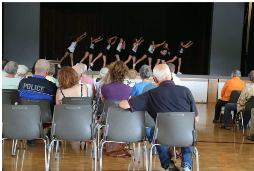
Spectacle de danse à la fin du forum

Moment clef de l'année de diagnostic, cette assemblée citoyenne, co-organisée par les groupes habitants et ressources sous la houlette des professionnels de Pro Senectute Vaud, a été ouverte à l'ensemble des 55 ans et plus de la commune et a eu lieu le samedi 24 juin 2017. La présence des acteurs impliqués dans la démarche et de l'ensemble de la Municipalité a permis d'établir un dialogue autour de la qualité de vie locale. L'enquête et les thématiques identifiées (voir annexe 2 : Schémas présentés lors du forum) ainsi que les principaux événements survenus depuis le début de la démarche ont été présentés au public. Après cet exposé, les différents ateliers autour des schémas susmentionnés ont permis à environ 90 participants de donner leur point de vue, mais aussi d'étoffer et de valider les résultats de la récolte des données. Il a résulté de chaque atelier des idées-forces qui constituent les fondements des actions potentielles, intégrées aux thématiques présentées dans la partie Résultats (p.26 et suivantes). A l'issue de la partie officielle, un moment festif et convivial, avec animation et apéritif dînatoire, a été offert aux participants. Durant celui-ci, les partenaires du projet ont également pu présenter leurs activités par le biais de stands d'information et échanger avec les personnes présentes.