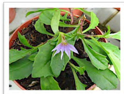
Voici, par ex., une Scaevola aemula en demi-corolle, forme exceptionnelle et plutôt rare!