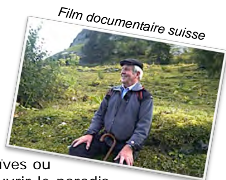
Film documentaire suisse

10 participants se sont rendus au City Club de Pully pour voir ce film. Ce documentaire de Stéphane Goël nous a emmenés non seulement sur des chemins des Préalpes fribourgeoises, mais également sur un cheminement intérieur. Qu'est-ce que le paradis ? Pour chacun d'entre nous la réponse est différente. Naïves ou cartésiennes, les réponses des personnes âgées nous font découvrir le paradis sous toutes ses formes. De beaux moments pleins de sensibilité et, pour clore la séance, la présence du réalisateur de ce documentaire.