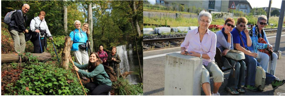
A gauche : marche d'une journée entre Romainmôtier et la Sarraz, à droite : petite pause bien méritée, lors d'une promenade dans le Lavaux. La marche est l'une des premières activités mises sur pied

Le 9 mars 2013 a eu lieu le troisième forum, qui a mis l'accent sur les activités actuelles et celles à construire, la mobilité ainsi que l'aménagement urbain et la sécurité. Des conseillers municipaux ont animé des ateliers en rapport avec leurs dicastères : Didier Lannaz celui sur la mobilité et Michel Farine celui sur l'aménagement urbain et la sécurité. L'événement a permis de faire connaître le projet et les premières activités mais aussi d'en construire de nouvelles, comme les visites-découvertes, qui consistent à visiter en groupe des entreprises d'Ecublens et alentours dans un but d'intégration et d'une meilleure connaissance de ce qui a lieu dans sa région. L'atelier sur la mobilité a fait mieux comprendre et accepter la suppression de la ligne de bus n° 30, de réfléchir aux déplacements dans la commune et de s'organiser pour des sorties en co-voiturage.