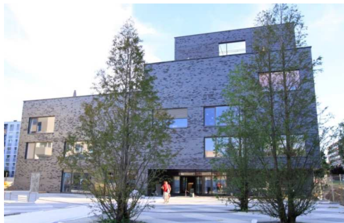
Le Centre socioculturel inauguré le 29 septembre 2012