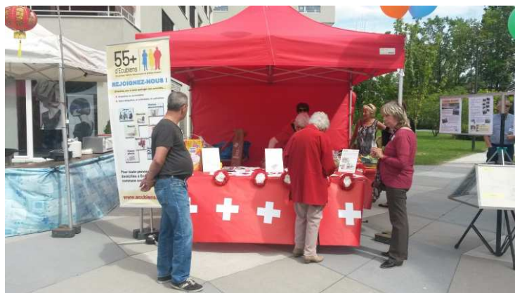
Le stand des « 55+ d'Ecublens », lors de la fête interculturelle annuelle organisée par la Commission d'intégration et d'échanges Suisse-étrangers

Au cours du « quartier solidaire », des partenaires se sont désengagés du processus et d'autres l'ont rejoint. Ainsi, le Cahier des autonomies, rédigé lors de la phase d'autonomisation, à l'automne 2015, est rempli par : la Commune, l'APREMADOL, l'EMS Clair-Soleil, le Centre de jeunes, POLOUEST, le groupe du Thé Contact de la Paroisse protestante, la Paroisse catholique, Pro Senectute Vaud et l'association « 55+ d'Ecublens ». Ce document a permis de préciser les collaborations entre chaque partenaire et l'association des aînés. Chacun y a noté ses besoins et attentes par rapport à l'association ainsi que les modalités de collaboration. Le Cahier a été signé lors de la fête de passation, le 23 avril 2016. Une convention unissant uniquement la Commune et l'association « 55+ d'Ecublens » a également été créée et signée lors de l'assemblée constitutive de l'association, le 6 février 2016.