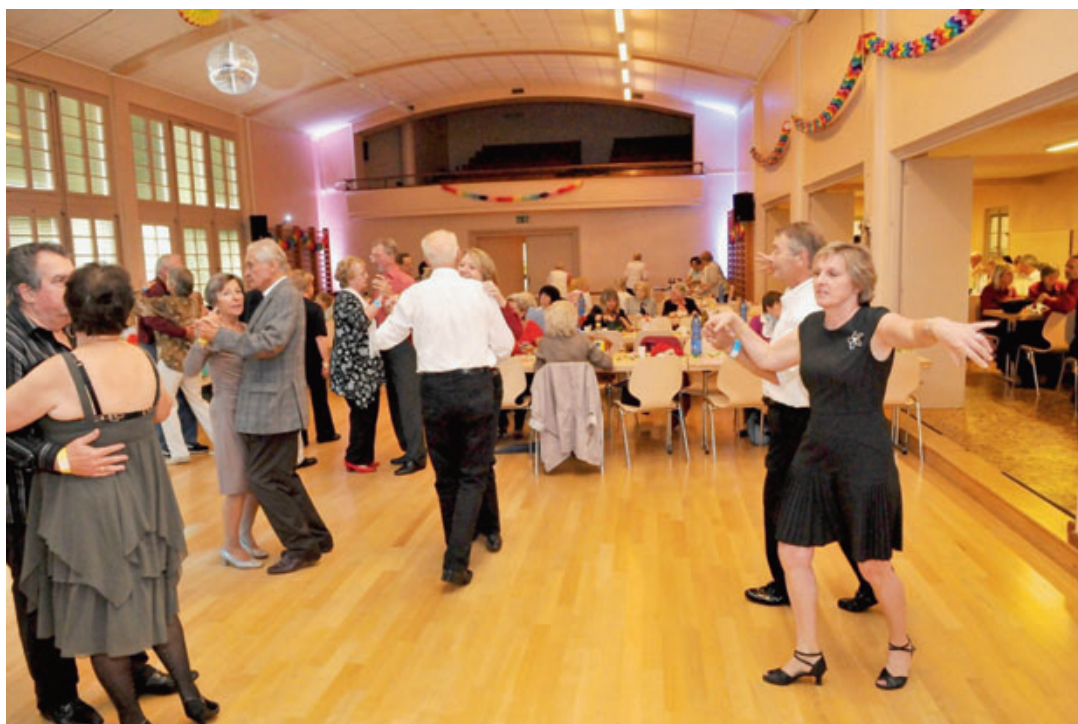
L'année dernière, reflet d'un rendez-vous dansant organisé par et pour les seniors.