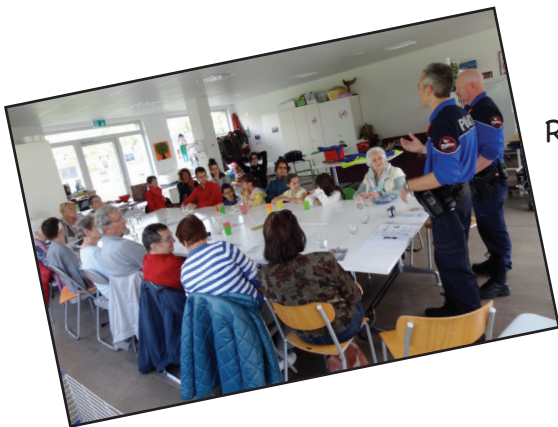
Rencontre avec la police de proximité - 3.05.17