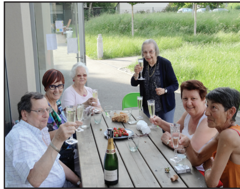
Apéritif groupe Forum Après l'effort, le réconfort - 30.05.17