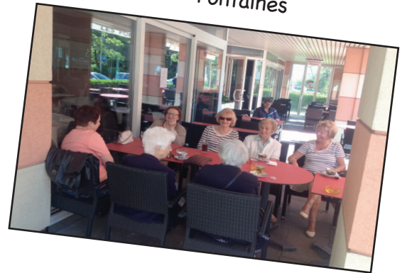
Les rencontres au café des Fontaines