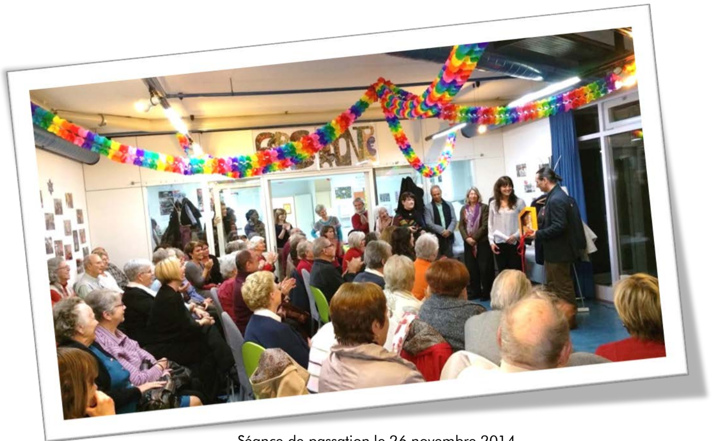
Séance de passation le 26 novembre 2014