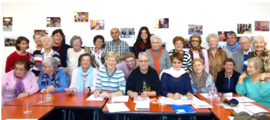
Le groupe habitants en 2013

Le groupe habitants conserve sa place prioritaire. Il est ouvert à tous ceux qui souhaitent assister à ses séances afin de s'informer, donner des idées, émettre des propositions de projets ou des réflexions et pour partager un moment convivial.