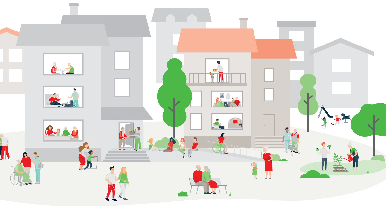
Illustration: Kathrin Locher/Rembrand AG

garantit, par des mesures ciblées, que ses prestations soient effectivement accessibles à la population des communes alentour.