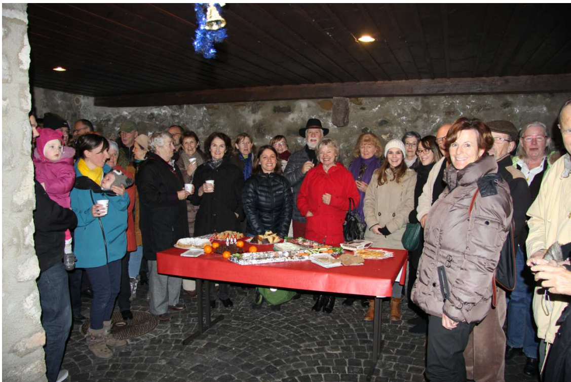
Fenêtre de l'Avent – décembre 2015

S'agissant du besoin de disposer d'un local de rencontre, cette perspective a favorisé l'émergence d'activités et de projets à mettre en place dans celui-ci. Un groupe de volontaires s'est formé après la visite du local de l'ancienne Poste et a rédigé une lettre collective adressée à la Municipalité afin d'obtenir le local de manière officielle. Cette première étape a montré l'implication des habitants et leur envie de développer ce projet.