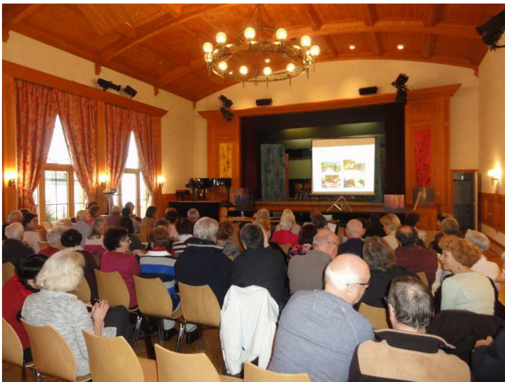
Premier forum – 23 avril 2016

Au cours des entretiens, les 95 personnes rencontrées ont dans l'ensemble témoigné se sentir bien dans leur commune notamment grâce au cadre de vie calme et à la proximité de la campagne et du lac. La richesse du patrimoine culturel de la région a également été mise en évidence. Ils ont toutefois déploré la quasi-absence de lieux de rencontre et le sentiment de vivre dans un « village dortoir » qui avait perdu son âme villageoise.