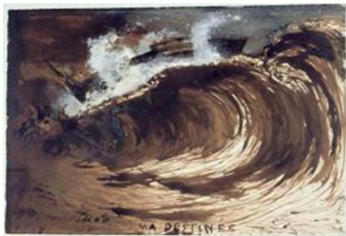
Ma destinée par Victor Hugo