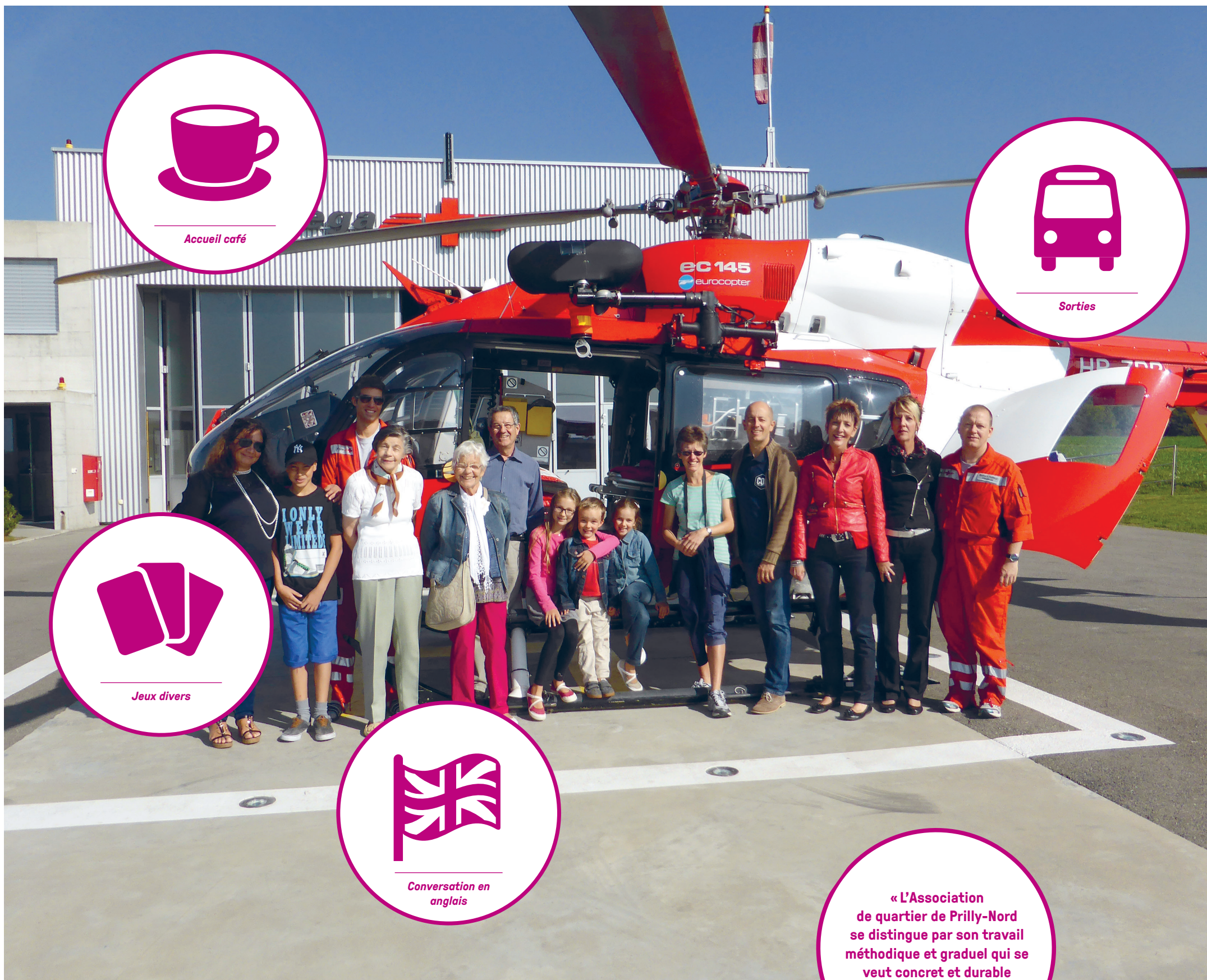
Sortie à la REGA – septembre 2014

Depuis 2011, l'Association de quartier de Prilly-Nord s'est constituée au terme du projet communautaire. Les habitants organisent des activités régulières et ponctuelles, dont trois sorties par année. La dernière a eu lieu à la REGA.