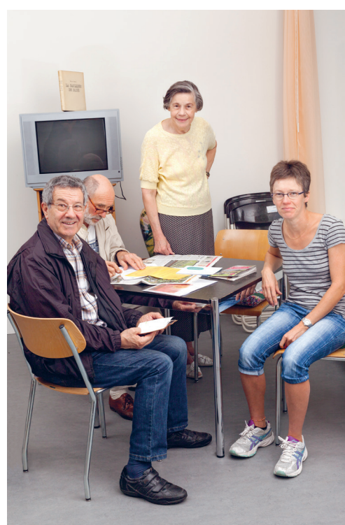
Le comité autour de la table – septembre 2014

pour l'Association de quartier de Prilly-Nord