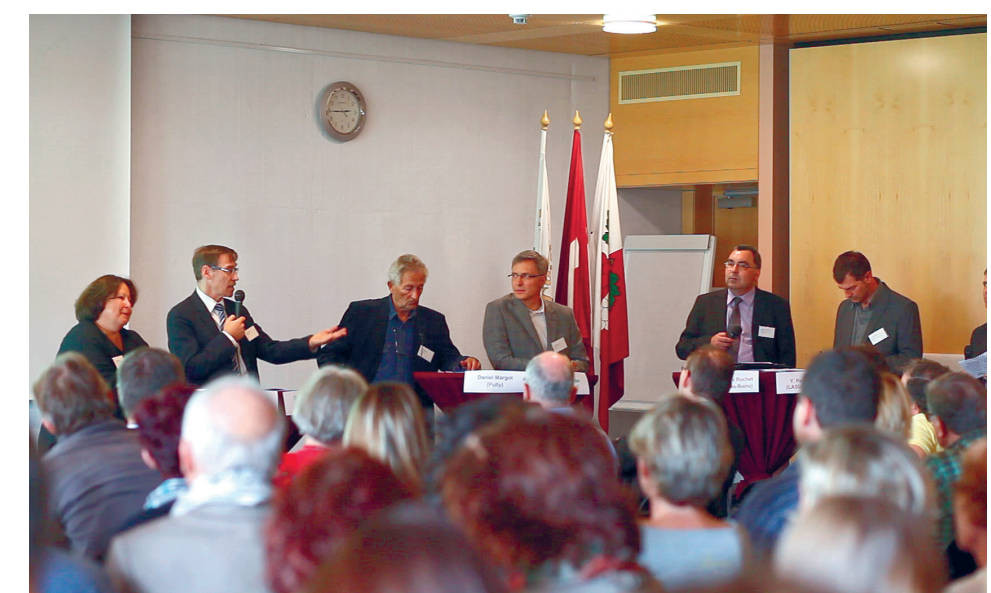
Municipaux et autres acteurs des quartiers solidaires lors de la Plateforme communautaire – novembre 2014