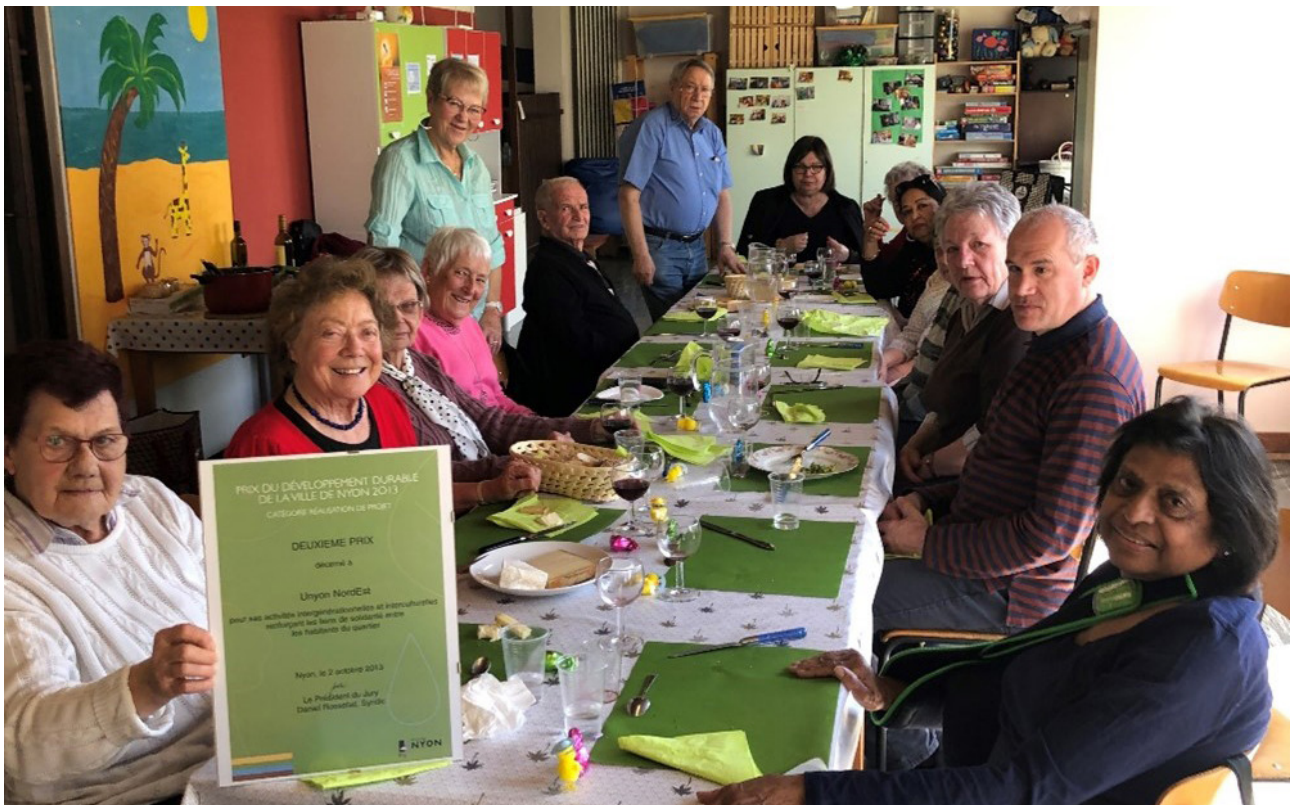
Unyon NordEst et son prix