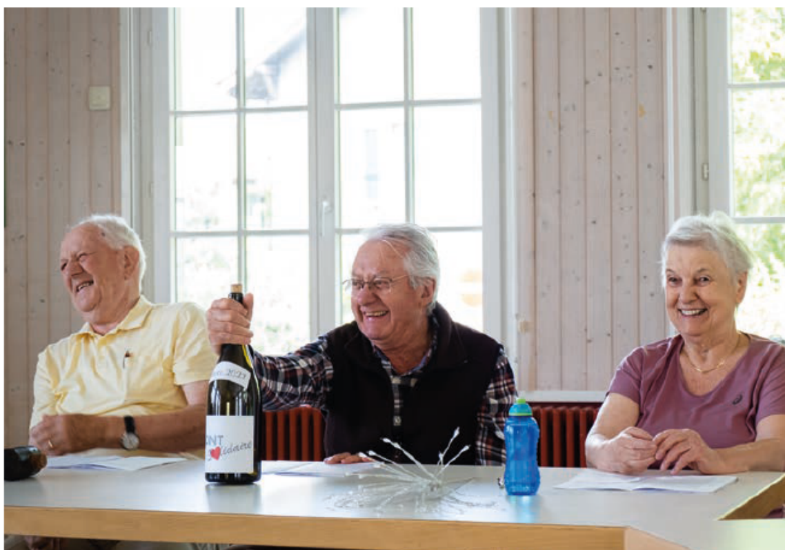
Difficile de garder son sérieux lors des répétitions du sketch « La baguette magique ». Les comédiens amateurs du Mont Solidaire prennent un malin plaisir à caricaturer leur propre personnalité.

L'association Mont Solidaire propose de nombreuses activités tout au long de l'année (pour les membres ou non dès 55 ans) : café solidaire, jass, pétanque, tricot, biodiversité (Jardimont), marche en forêt, cybercafé, activités culturelles, etc.