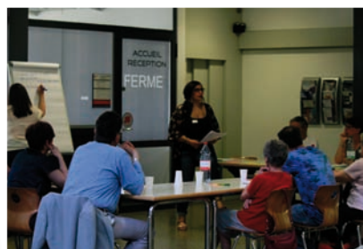
L'atelier «aspects sociaux et économiques».