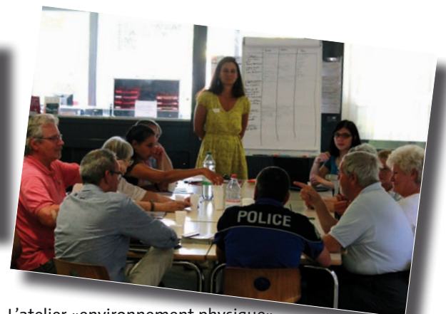
L'atelier «environnement physique».

Deux ateliers autour de la thématique «Qualité de vie» se sont tenus, samedi après-midi au CPNV, à Yverdon-les-Bains. La chaleur ayant peut-être découragé certains habitants de la rue des Moulins, une petite trentaine de participants ont joué le jeu avec intérêt et pertinence.