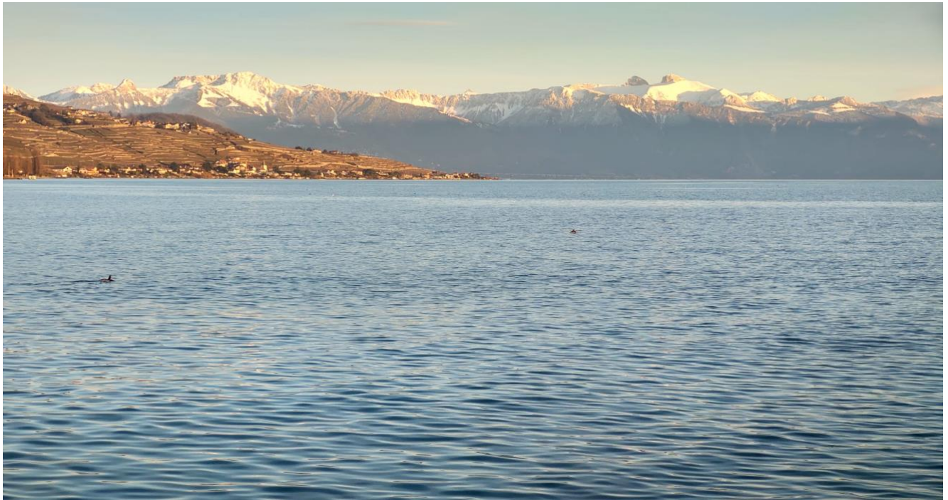
Vue sur le lac

Bulletin d'information de LA MOSAÏQUE DE PULLY NORD DOUZIÈME année, N° 62, Mars-Avril 2025