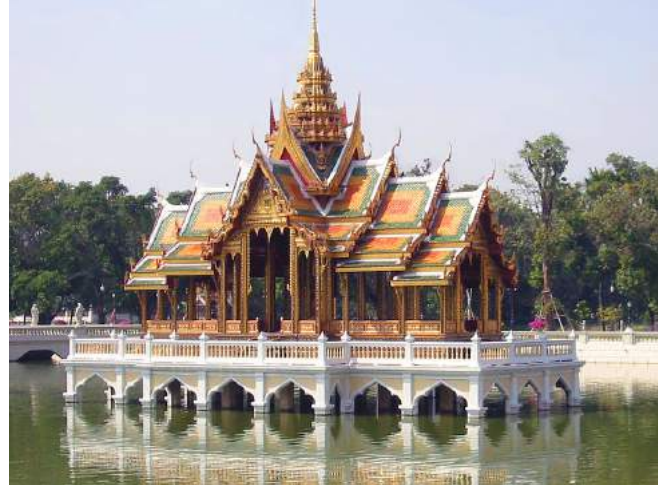
Pavillon du palais royal de Bang Pa-In