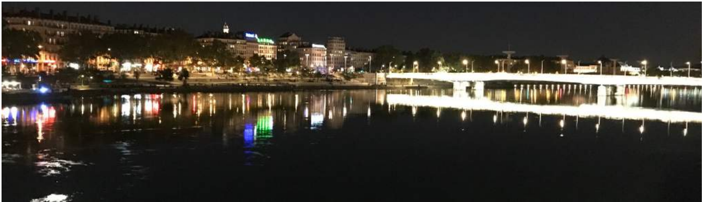
À Lyon, le Rhône de nuit

Bulletin d'information de LA MOSAÏQUE DE PULLY NORD Sixième année, N° 32, Novembre – Décembre 2019