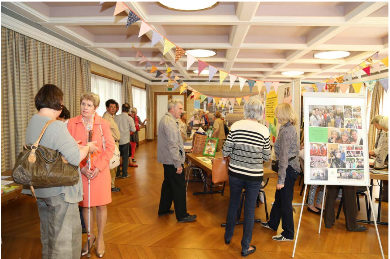
Forum – salon des activités, mai 2015