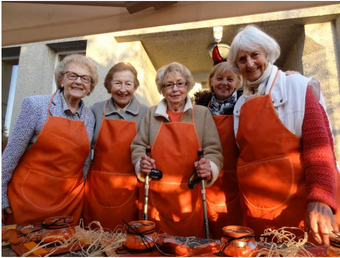
Fêtes d'Halloween, novembre 2014