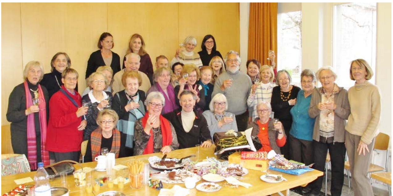
Un anniversaire fêté lors de l'accueil café, décembre 2015

Durant ces quatre dernières années, de nombreux événements et projets ont été menés à bien, dont ceux illustrés ci-dessous. L'Écho du Riolet en fait partie ; cette feuille d'information réalisée par les habitants et diffusée avec le soutien de la Ville transmet régulièrement des renseignements sur les activités proposées et sur celles d'autres organismes du quartier. Par ailleurs, le nom choisi pour l'association est une belle métaphore quant à son fonctionnement : le groupe habitants, principal organe décisionnel, fonctionne de manière harmonieuse tout en étant constitué d'une vingtaine de personnalités particulières.