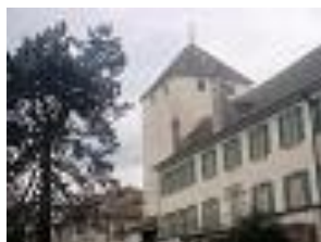
La Cave du Château - St-Prex

Réservation 0218061047 /entrée libre (collecte)