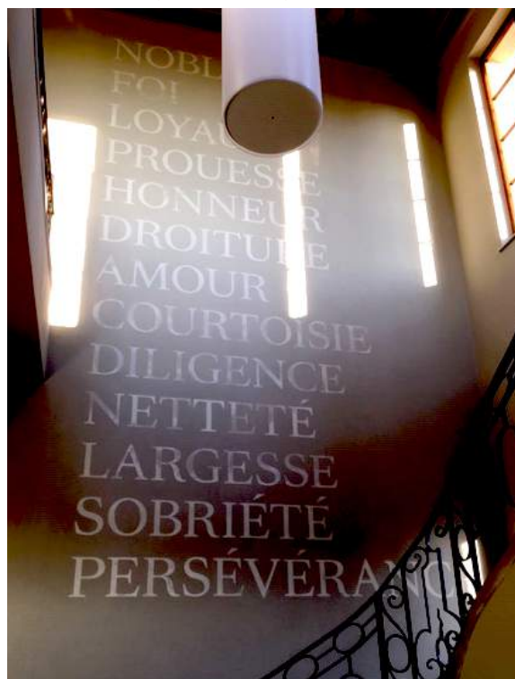
Texte et photos : Annick Hislaire