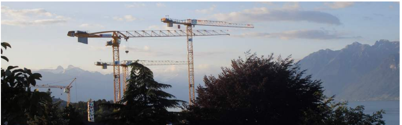
Panorama estival à Pully Nord

Bulletin d'information de LA MOSAÏQUE DE PULLY NORD Sixième année, N° 30, Juillet - Août 2019