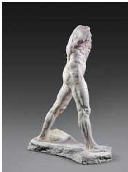
L'homme qui marche de Rodin

J'avais hésité à y aller... Ouais, Giacometti, Rodin, on connaît. Quelle erreur ! Je suis rentrée chez moi éblouie ! La mise en correspondance de leurs deux mondes m'a fascinée. De les voir ainsi, en regard croisé, enrichit l'accès, à l'un comme à l'autre. Je découvre comment chacun, à deux générations de distance (Rodin 1840 – 1917 / Giacometti 1901 – 1966) donne vie à des bustes, dont j'ignorais l'existence. Dans le cahier de l'exposition, je lis que Rodin s'est distancé de l'académisme de l'époque, notamment en intégrant dans ses œuvres les « accidents » : « Les fragments, les omissions (...), les accidents dans le processus créatif, ne sont pas associés à l'échec