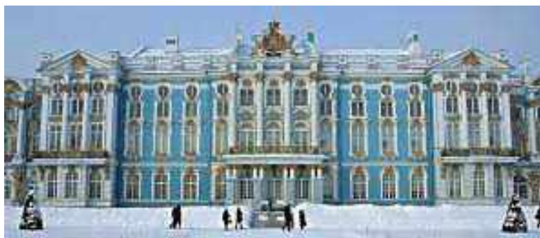
Palais de Catherine à Tsarskoïe-Selo