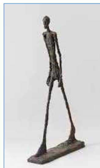
L'homme qui marche de Giacometti

Après avoir plongé dans ces univers, chacun/e à son rythme, nous nous retrouvons à la cafétéria du musée pour « casser la graine » et reprendre la route. Merci à la Mosaïque d'avoir organisé cette visite !