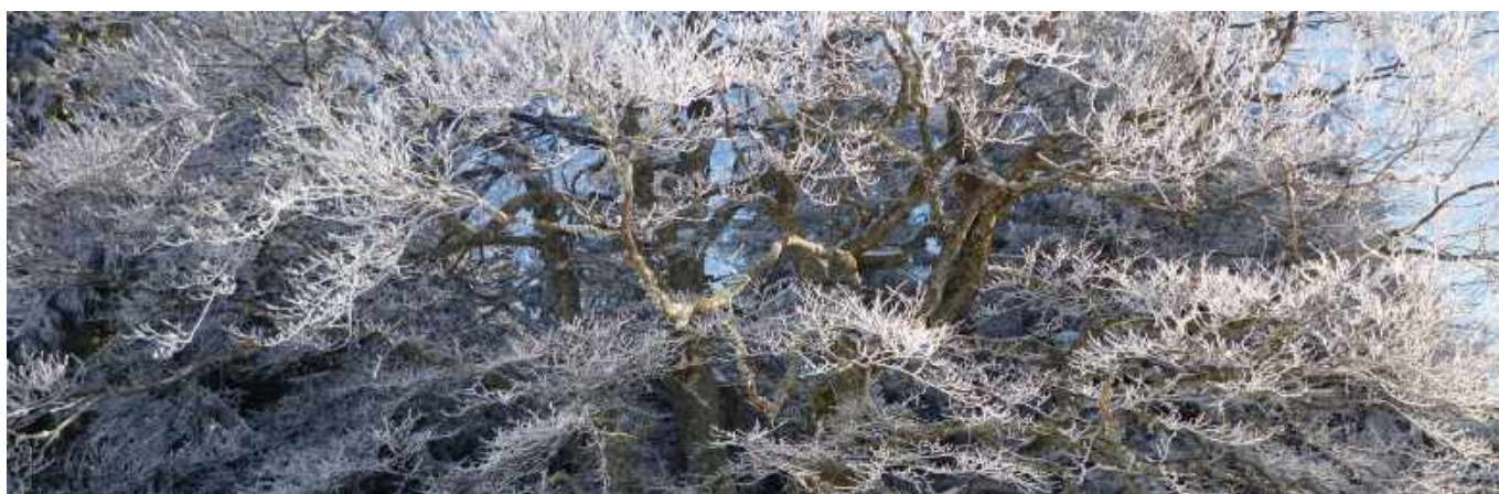
Arbre recouvert de givre

Bulletin d'information de LA MOSAÏQUE DE PULLY NORD Septième année, N° 33, Janvier – Février 2020