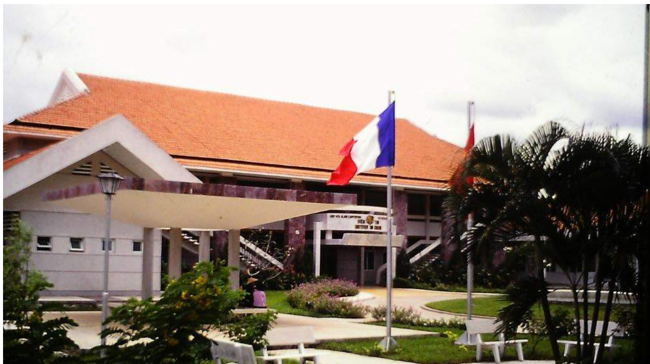
Institut du Cœur à Saïgon, au Vietnam