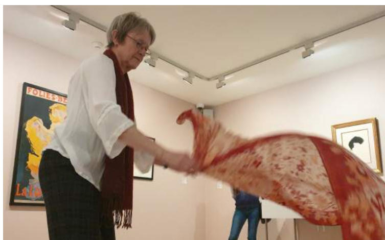
Anouchka Okhonin et Jeremy Gafas (texte et photos)

Enfin presque, puisque les discussions se sont ensuite poursuivies autour d'un verre, de biscuits LU et de « flans parisiens » dans les combles du musée pour un moment convivial.