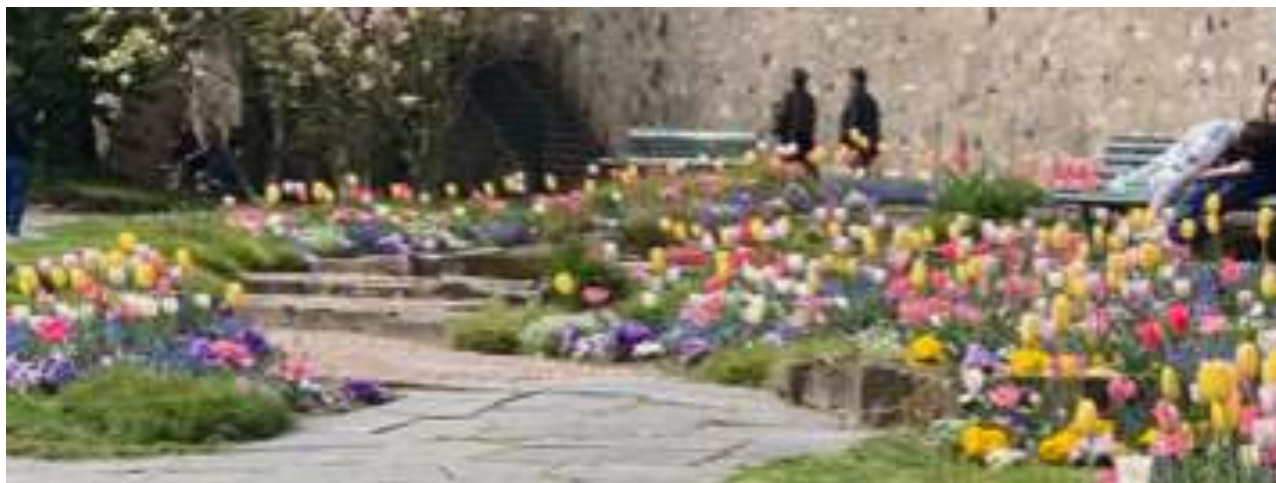
Le printemps est arrivé à Lausanne

Bulletin d'information de LA MOSAÏQUE DE PULLY NORD Neuvième année, N° 45, Mai – Juin 2022