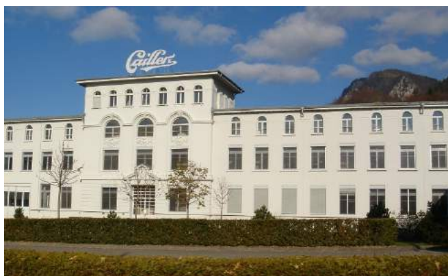
LA MAISON CAILLER

Le mercredi 8 juin, notre autocar nous mènera à Broc dans le canton de Fribourg où nous visiterons La Maison Cailler et Electrobroc