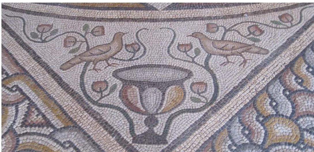
Mosaïque à Rhodes