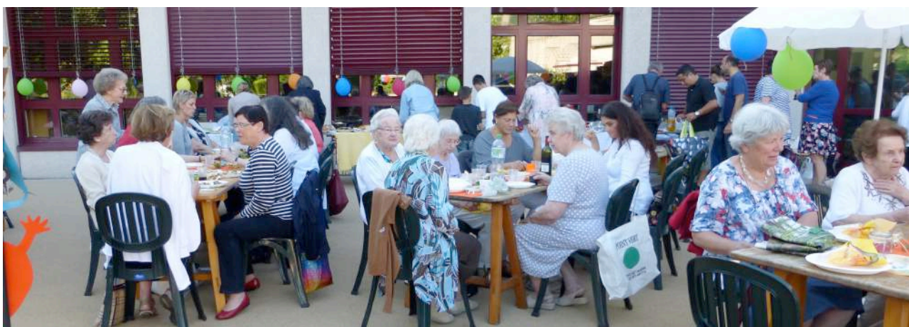
Fête de la Cour à Fontanettaz en 2014

Jusqu'alors les voisins, même connus de longue date, se saluaient sans plus. Si bien que le groupe du Quartier solidaire de Pully-Nord s'est lancé dans une aventure : rassembler toutes et tous par une joyeuse rencontre.