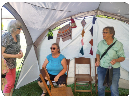
Il fait trop chaud pour enfiler l'un de ces magnifiques tricots!