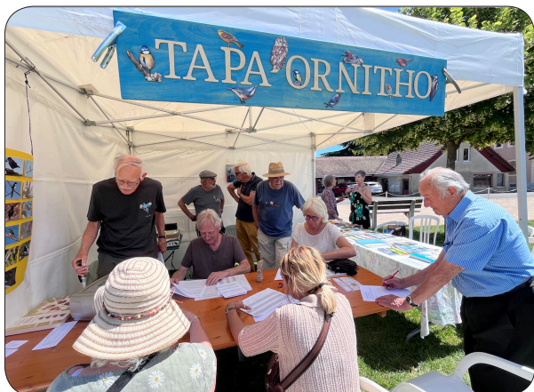
... celui-là avec le bec jaune, c'est un merle?