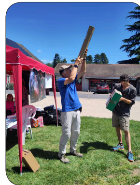
«On distingue les zones les plus froides du soleil».