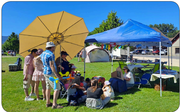
Un moment privilégié autour d'un conte