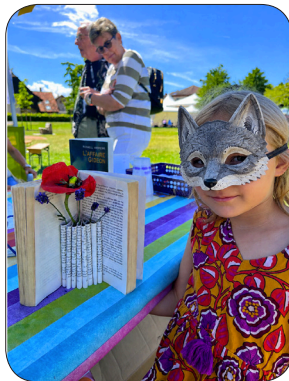
Une fillette fière de son bricolage.