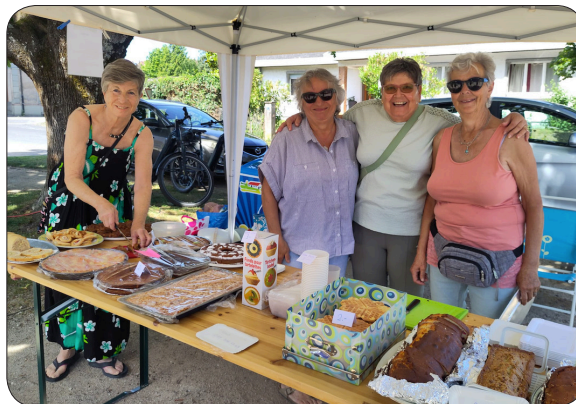
Les délices de la journée: que ce soit la paella, les wraps, les glaces ou les pâtisseries, c'est toujours proposé avec le sourire!